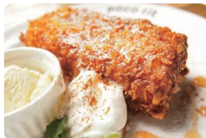
クリスピーフレンチ