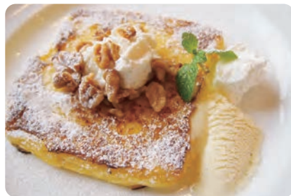
リコッタチーズ&amp;クルミ