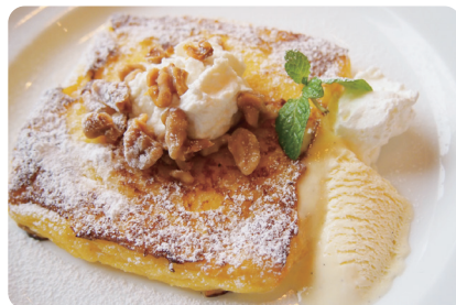
リコッタチーズ&amp;クルミ