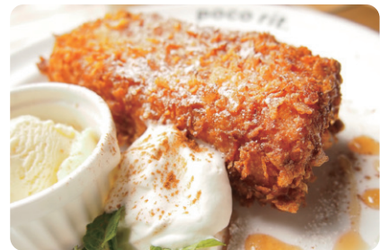
クリスピーフレンチ